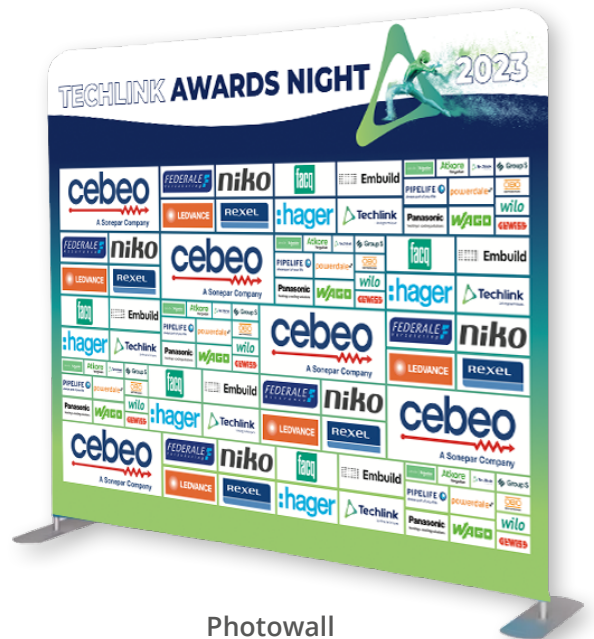
Photowall (niet-contractuele foto)