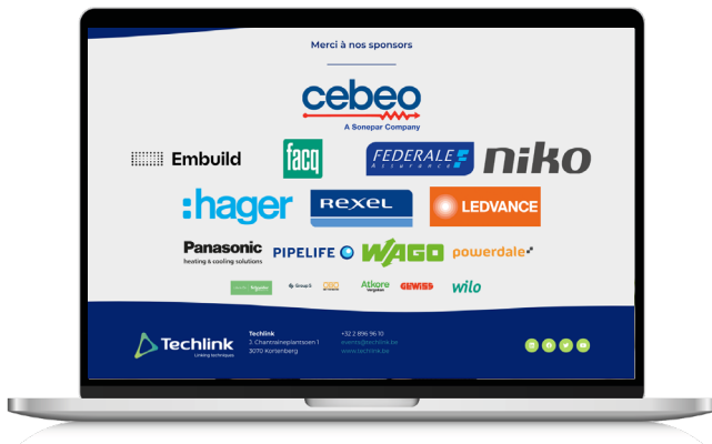
Logo op de website